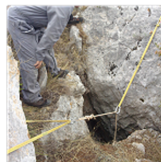
accrochage naturel sur rocher